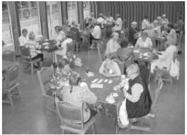
Das Foto zeigt die Bridgefreunde aus Oestergaard und Tarp während ihres Turniers im „Haus an der Treene“

Wir vertreten uns mittlerweile die Beine - es regnet immer noch. Endlich setzen wir uns zum Essen und Trinken im schön gedeckten Raum hin. Getränke werden geordert, da kommt Karl erhitzt von so viel Kopfarbeit in den Raum und erlöst alle von