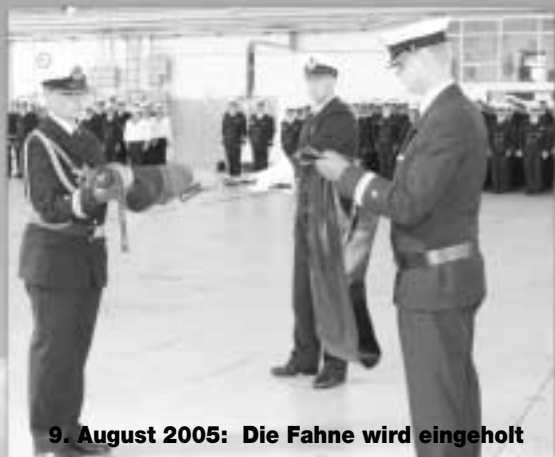
9. August 2005: Die Fahne wird eingeholt