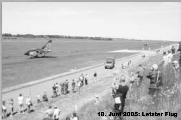
18. Juni 2005: Letzter Flug