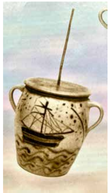
Bild 2 Rummelpott

Foto: Bild 1 Oeverseer Jungs beim Rummelpottlaufen.