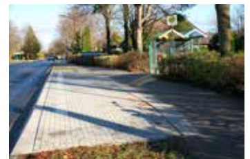
Foto: Barrierefreie Bushaltestellen, hier an der Flensburger Straße und das Tarper Klärwerk, das ab dem 1. Januar vom Wasserverband Nord betreut wird.