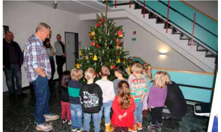
Foto: Eine Abordnung von der KiTa Havetoft „Storchennest“ schmückt den Weihnachtsbaum im Amtsgebäude.