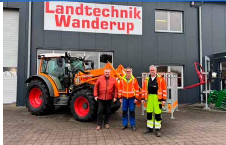
Bild: Der neue Gemeindeschlepper wird bei der Firma Landtechnik in Wanderup übernommen.