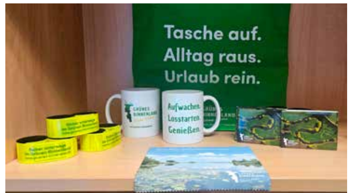
BU: Regionale Produkte, Erinnerungsstücke sowie Infomaterial findet man in der Touristinformation.