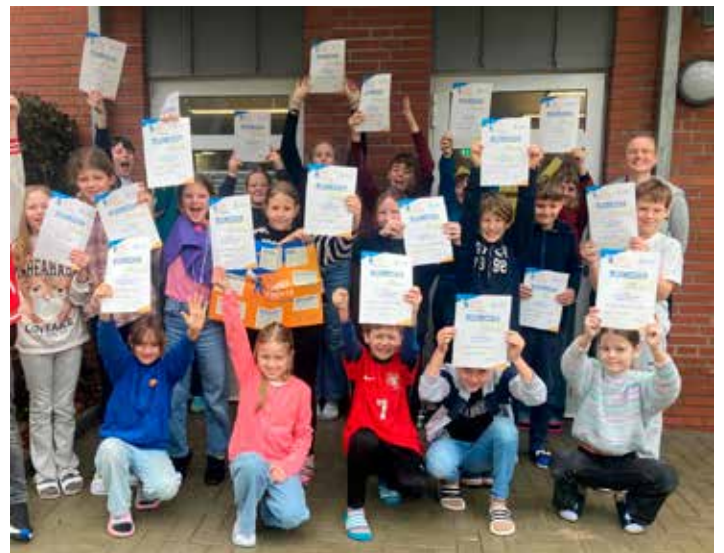
Bild: Geschafft! Zwei Tage voller Lernen, Spaß und Teamgeist und am Ende eine wohlverdiente Urkunde